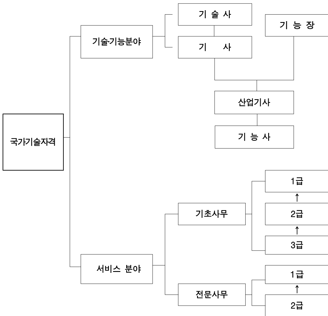
[그림2] 국가기술자격제도 체계